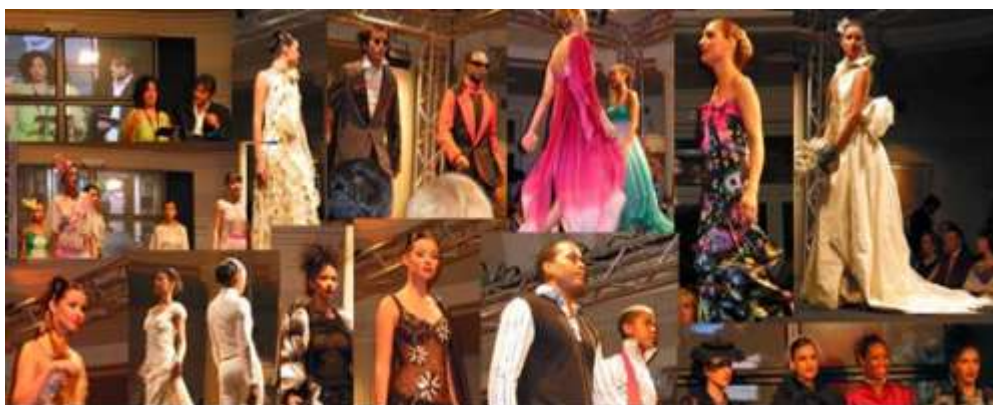
*Desfile en el Hotel Carlton de Bilbao

El evento tuvo repercusión en los medios de comunicación. Este artículo se publicó en el diario DEIA el 8 de junio de 2005.