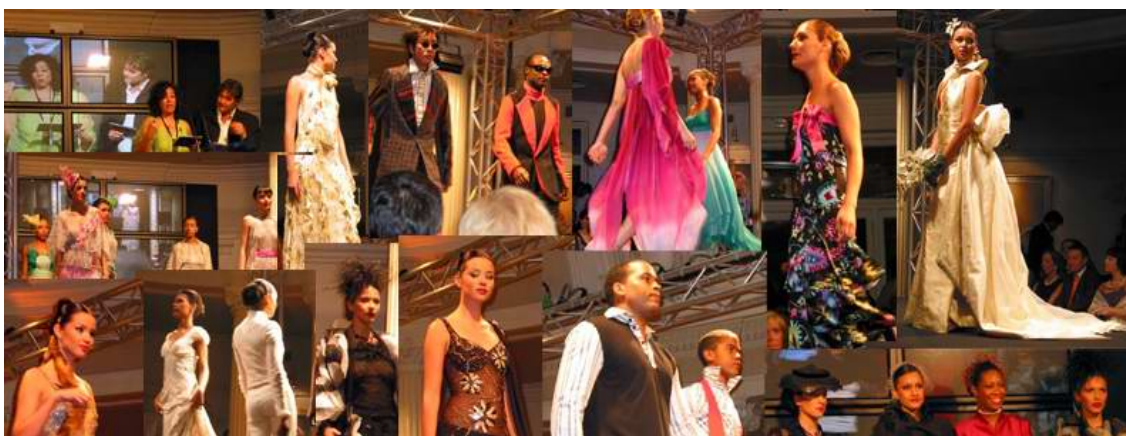
*Desfile en el Hotel Carlton de Bilbao

El evento tuvo repercusión en los medios de comunicación de Bizkaia. Este artículo se publicó en el diario DEIA el 8 de junio de 2005.