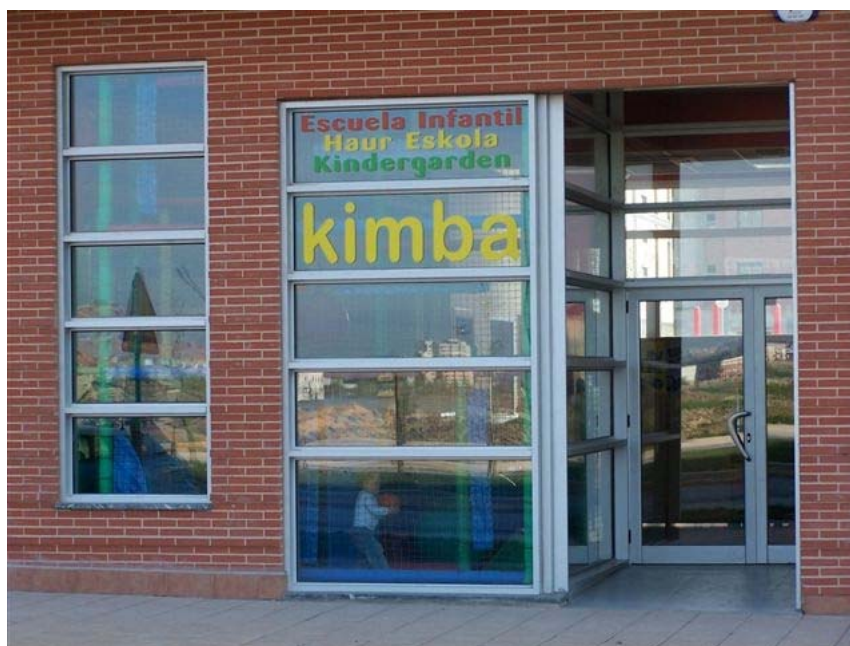
* Fachada Escuela Infantil KIMBA en el barrio de Zabalzana de Vitoria- Gasteiz

Los buenos resultados obtenidos en los 10 años de funcionamiento de Izalde, llevaron a FNCE a abrir una nueva escuela en septiembre de 2005 en el barrio vitoriano de Zabalzana, una zona de expansión de la ciudad. KIMBA, que es el nombre de este centro de educación, será la enseña que FNCE ha elegido para franquiciar su modelo educativo.