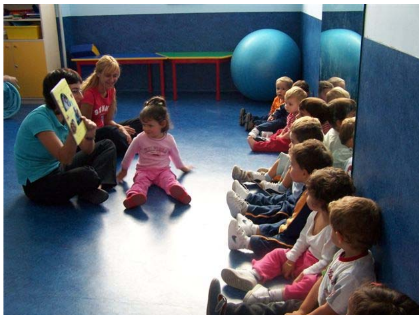
*La estimulación temprana es uno de los pilares del modelo educativo de FNCE